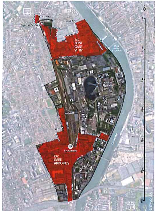
Périmètre des Ardoines, de la ZAC Seine Gare Vitry et de la ZAC gare Ardoines – Source : epa-orsa.fr

Au total, le pétitionnaire estime que le quartier peut ainsi être amené à accueillir 10 000 nouveaux habitants et 4 000 emplois.