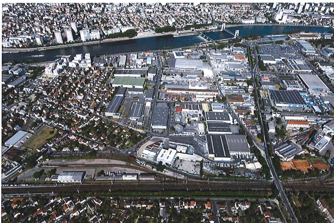
Vue aérienne du site d'implantation du projet, vers l'est

L'état initial est de bonne qualité, tant sur la prise en compte de l'environnement que sur la clarté du dossier. Une analyse de plus en plus précise des enjeux environnementaux est attendue à chaque étape d'avancement du projet. Des compléments notamment sur les enjeux relatifs à l'eau (inondation, gestion de l'eau) ont ainsi été intégrés dans le cadre du dossier loi sur l'eau. L'étude d'impact n'a toutefois pas été actualisée.